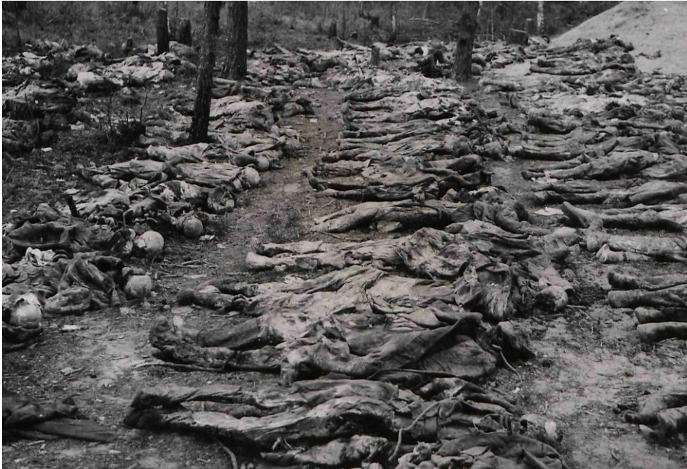
Zwłoki wydobyte z „dołów mordów”.