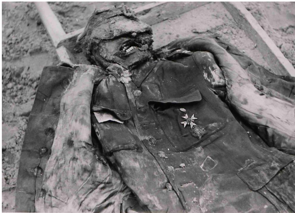
Zwłoki majora Wojska Polskiego.