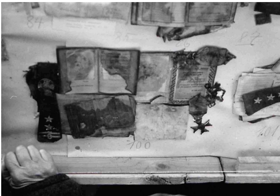
Dokumenty, ordery i naramienniki ofiar.