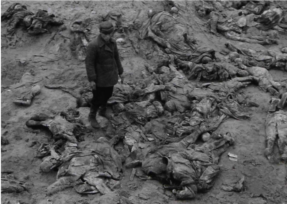
Miejscowy robotnik podczas prac ekshumacyjnych.