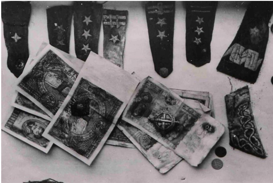
Naramienniki, banknoty i monety.